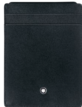
Meisterstück Carteira 4 cc com Porta-Cartões

Material: Pele de bezerro texturada europeia curtida a crómio, integralmente tingida e com o brilho intenso e único Montblanc Capacidade e Organização: 4 ranhuras para cartões de crédito, 3 bolsos adicionais Características Adicionais: Bolso removível com janela para cartão do cidadão Cor: Preto Dimensões: 9 × 12 cm Nº de Ident.: 2665