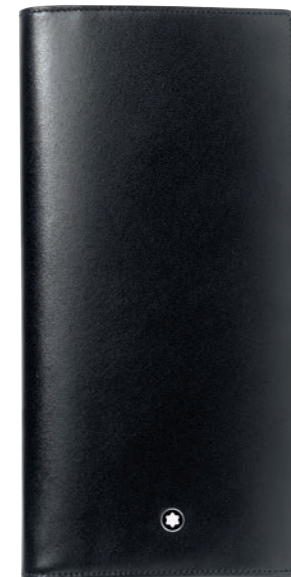
Meisterstück Carteira 14 cc com Bolso com Fecho de Correr

Cores Adicionais: Nº de Ident.: 114559 Castanho Nº de Ident.: 114560 Azul Marinho Nº de Ident.: 114561 Burgundy