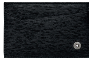
4810 Westside Porta-Cartões 2 cc

Material: Couro de bezerro italiano texturado curtido a crómio, pigmentado, integralmente tingido, com um delicado acabamento de impressão