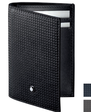
Montblanc Extreme Porta-Cartões de Visita

Material: Couro com subtil look de carbono