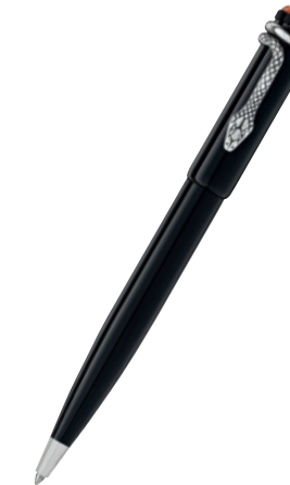
Montblanc Heritage Rouge et Noir Special Edition Black Esferográfica

Sistema de Escrita: Rollerball Corpo: Lacado precioso preto Tampa: Resina preciosa preta com o emblema Montblanc em resina em cor de coral e marfim Acabamento: Detalhes com patina e parte dianteira em metal a condizer Clip: Serpente em estilo vintage Características Especiais: Tamanho novo e único - fino e comprido Nº de Ident.: 114723