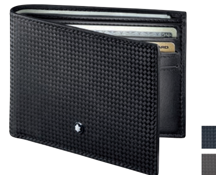
Montblanc Extreme Carteira 6 cc

Material: Couro com subtil look de carbono