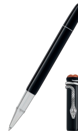
Montblanc Heritage Rouge et Noir Special Edition Black Rollerball

Sistema de Escrita: Esferográfica Corpo: Lacado precioso em cor coral Tampa: Resina preciosa em cor coral, com o emblema Montblanc em resina com as cores coral e marfim Acabamento: Detalhes com patina e parte dianteira em metal a condizer Clip: Serpente em estilo vintage com olhos com duas pedras verdes Características Especiais: Tamanho novo e único - fino e comprido Nº de Ident.: 114727