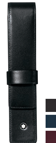
Meisterstück Estojo para 1 Caneta

Material: Pele de bezerro texturada europeia curtida a crómio, integralmente tingida e com o brilho intenso e único Montblanc Capacidade e Organização: 14 ranhuras para cartões de crédito, bolso grande com fecho, 2 compartimentos para notas, 2 bolsos adicionais Cor: Preto Dimensões: 9,5 × 19 cm Nº de Ident.: 7165