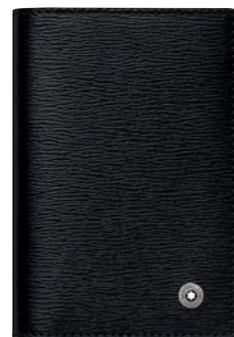
4810 Westside Porta-Cartões de Visita

Material: Couro de bezerro italiano texturado curtido a crómio, pigmentado, integralmente tingido, com um delicado acabamento de impressão