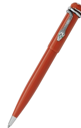
Montblanc Heritage Rouge et Noir Special Edition Coral Esferográfica

Sistema de Escrita: Esferográfica Corpo: Lacado precioso em cor coral Tampa: Resina preciosa em cor coral, com o emblema Montblanc em resina com as cores coral e marfim Acabamento: Detalhes com patina e parte dianteira em metal a condizer Clip: Serpente em estilo vintage com olhos com duas pedras verdes Características Especiais: Tamanho novo e único - fino e comprido Nº de Ident.: 114727