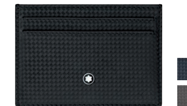
Montblanc Extreme Porta-Cartões 5 cc

Material: Couro com subtil look de carbono