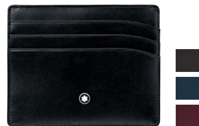
Meisterstück Porta-Cartões 6 cc

Material: Pele de bezerro texturada europeia curtida a crómio, integralmente tingida e com o brilho intenso e único Montblanc Capacidade e Organização: 4 ranhuras para cartões de crédito, 3 bolsos adicionais Características Adicionais: Bolso removível com janela para cartão do cidadão Cor: Preto Dimensões: 9 × 12 cm Nº de Ident.: 2665